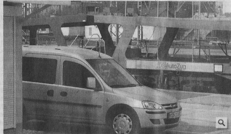
Der Autozug soll nach Plänen der Bahn bis spätestens 2017 verschwinden.

Bis 2017 zieht die Deutsche Bahn die Notbremse für eine unrentabel ANZEIGE gewordene Sparte: den Autozug. Innerlich hat sich der Konzern schon lange von ihm verabschiedet. Nachruf